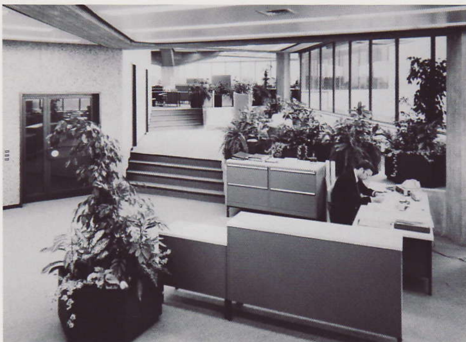
Das Versprechen von Freiheit, auch am Arbeitsplatz. Blick aus einem Sechseck ins nächste.